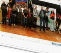
Prêt pour découvrir l'histoire du CCFD mise en scène par les jeunes.