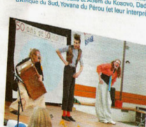
Prêt pour découvrir l'histoire du CCFD mise en scène par les jeunes.