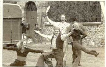
« La Lanterne Magique » a brillé de tous ses feux

La Lanterne Magique a été accompagnée par le groupe "Les Ailes de l'ange", composé de plusieurs élus de la commune, de la commune de Neuville, ont suivi avec enthousiasme cette première partie du spectacle. Le public, la qualité des numéros présentés, l'ambiance parfaite avec le public ont fait le succès de cet après-midi. Le seul regret formulé de façon unanime fut le manque de température, « un peu fraîche pour la saison par rapport à 2008 ! ». Mais on peut dire qu'après il n'y a plus jamais fait aussi bon jusqu'à l'automne !