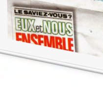
Prêt pour découvrir l'histoire du CCFD mise en scène par les jeunes.