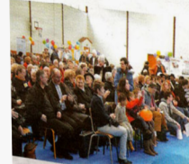
Prêt pour découvrir l'histoire du CCFD mise en scène par les jeunes.