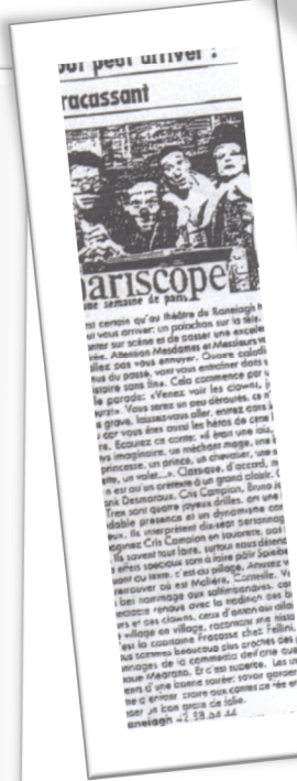
Tout peut arriver : racassant

● THEATRE DU RANELAGH, 5, rue des Vignes, 16 e (42.88.64.44). Jusqu'à fin décembre.