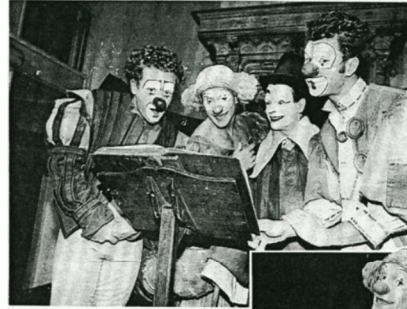
Au Théâtre du Ranelagh, dans la X VI e , les quatre joyeux drilles de « Tout peut arriver », déguisés en clowns, s'attaquent aux contes de fées comme aux histoires d'aventures et les transforment en un spectacle hilarant et décapant.

Avec ces quatre clowns, « Tout peut arriver » ! Ces personnages drôlistes au nez rouge incarnent au Théâtre du Ranelagh (XVI e ) 17 personnages d'un conte de fées pas comme les autres.