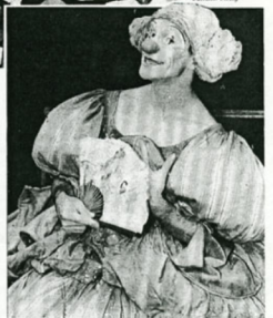
À 21 heures, du mardi au samedi, 17 heures dimanche. Théâtre du Ranelagh, 5, rue des Vignes, Paris XVI e , 16.

Leur pêche d'ender, présence inimitable, jouent à toutes les disciplines et leur amour-communicatif de la scène fait tout éclater en un brillant feu d'artifice.