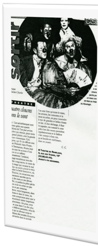
Les clowns de « Tout peut arriver »